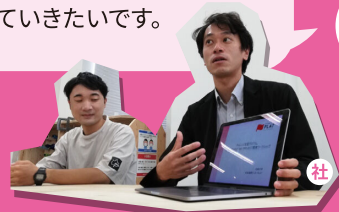
団体プロフィール